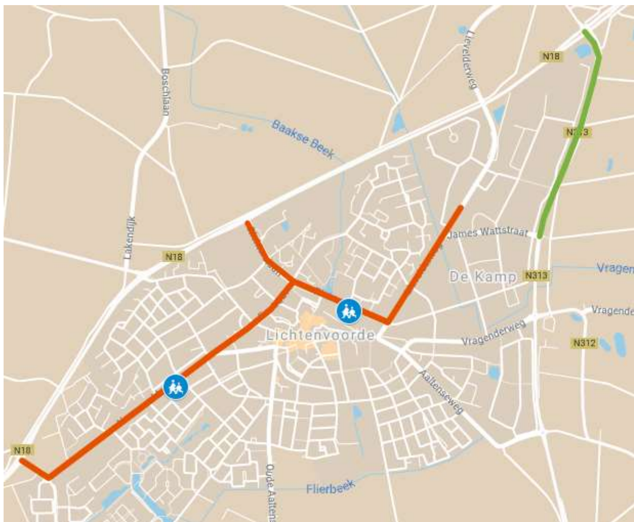
Figuur 1: Routes naar bedrijventerrein De Kamp (groen = gewenste route, rood = ongewenste route)